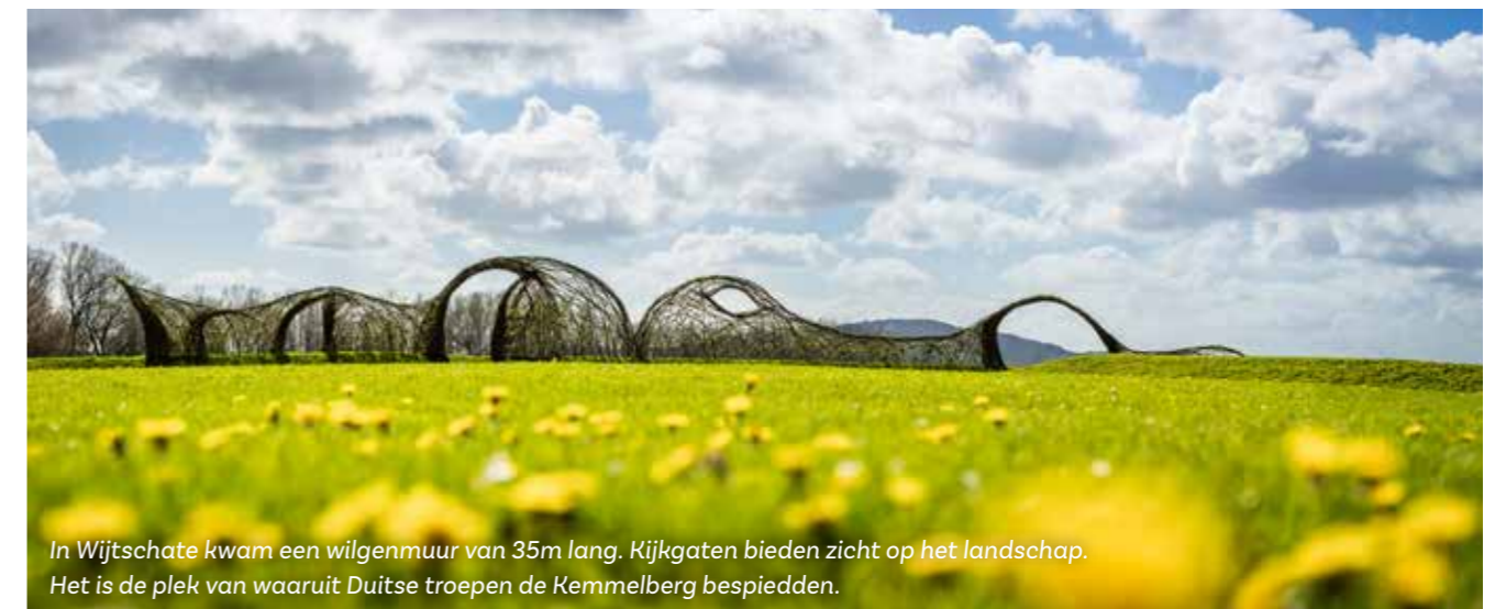
In Wijtschate kwam een wilgenmuur van 35m lang. Kijkgaten bieden zicht op het landschap. Het is de plek van waaruit Duitse troepen de Kemmelberg bespieden.

Geprickeld om de werken te ontdekken? Spring op de fiets en verken de Westhoek aan de hand van 6 fietstochten langs de landschapskunstwerken die het verhaal van het onzichtbare landschap opnieuw zichtbaar maken. Je vindt de fietstochten in de pocket van Westtoer in elk toeristisch kantoor in de Westhoek, of je kan fietsen onder begeleiding van de ErfgoedApp. De routes volgen de knooppunten van het fietsnetwerk. Een overzicht van de routes vind je op www.onzichtbaarlandschap.be . Dit project is een samenwerking met regionaal landschap Westhoek.