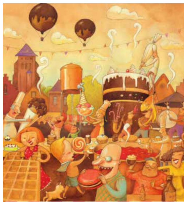
ZOETEMARKT KEMMEL Pinkstermaandag

Op sinksenmaandag (pinkstermaandag) zal het opnieuw over de koppen lopen zijn op de Kemmelse Dries! Dan komen alle zoetmondjes genieten van allerlei zoetigheden, taarten en koeken op de jaarlijkse Zoetemarkt. Ook de gezellige sfeer met allerhande doe- en kijkanimatie en muzikale omljsting is om duimen en vingers bij af te likken.