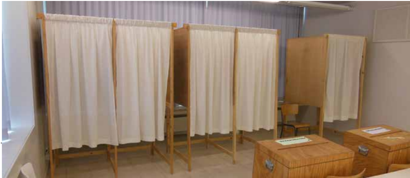
In juni en oktober zijn er verkiezingen. Op je oproepingskaart staat waar we je verwachten.

2024 wordt een verkiezingsjaar bij uitstek. In juni zijn het Europese, federale en Vlaamse verkiezingen. Alsof dat nog niet genoeg bolletjes te kleuren zijn, zijn er in oktober ook gemeenteraads- en provincieverkiezingen. Maar ben je verplicht om te gaan stemmen? Wat als je niet kan gaan stemmen? Mag je dan een volmacht geven? Om je wat wegwijs te maken tijdens de verkiezingen sommen we de belangrijkste punten voor je op.