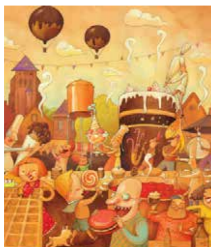
ZOETEMARKT KEMMEL Pinkstermaandag